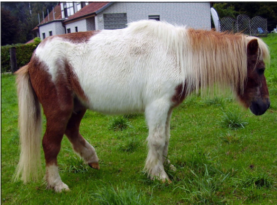
Pony mit chronischen Schmerzen

Schmerz ist eine sinnvolle Schutzeinrichtung des Körpers, um Schlimmeres zu verhindern. Deshalb nehmen Pferde bei Schmerzen so genannte Schonhaltungen ein: so kann Schmerz in einem Bein oder Huf zu Lahmheit bis hin zur vollständigen Entlastung des Beines führen oder Kolikschmerz zum Aufkrümmen des Rückens. Schmerz kann Folge lebensbedrohlicher Zustände sein, er kann aber auch eine leicht zu behandelnde Ursache haben. Wird Schmerz nicht erkannt, kann dies zu Leiden und tierschutzrelevanten Problemen führen (chronische Schmerzen)!