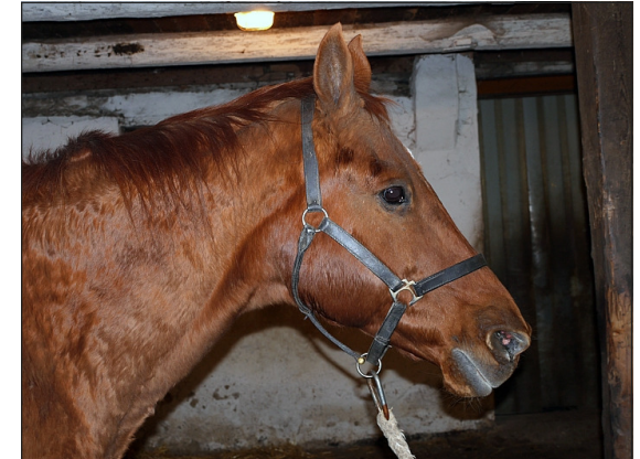
Pferd mit akuten Schmerzen

Eine Initiative der Tierärztekammer Niedersachsen www.tknds.de